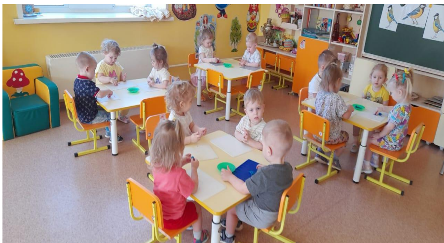
Лепят зёрнышки для птичек