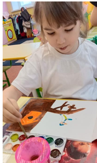
Рисование «Мелкие пичуги»