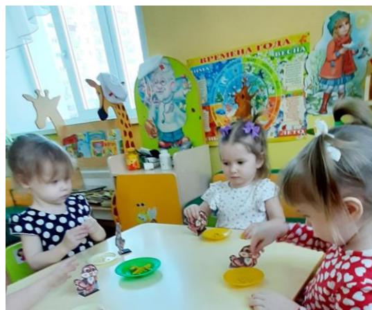
Лепят зёрнышки для птичек и кормят их