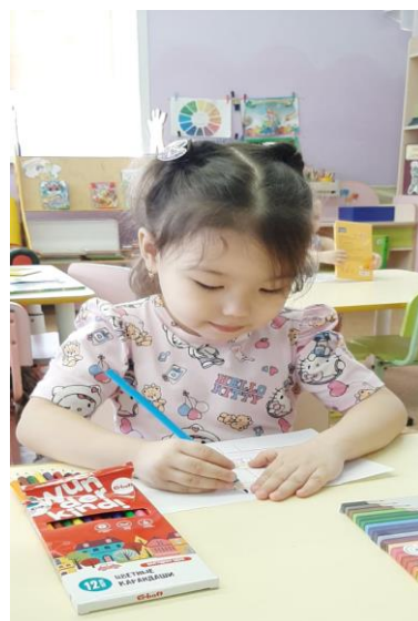
Раскрашивают кормушки и птичек

4. Во второй младшей группе «Море» педагоги провели с детьми беседу «Птицы нашего края». Цель беседы: формирование представлений у детей о птицах родного края, воспитание заботливого отношения к птицам, желании заботиться о них, охранять. Педагоги познакомили детей с птицами, которые проживают в Кемеровской области. Дети пробовали по отличительным признакам узнавать, что за птица. Предложили поиграть в дидактическую игру «Разрезные картинки», закрепили знания о внешнем виде птиц, его отличительных признаках. Дети учились собирать изображение птиц из отдельных частей. Далее педагоги организовали ООД «Птицы» аппликация. Дети учились передавать в аппликации образ птички, особенности формы головы, туловища, хвоста и крыльев. В честь