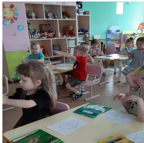
Играют в пальчиковую гимнастику