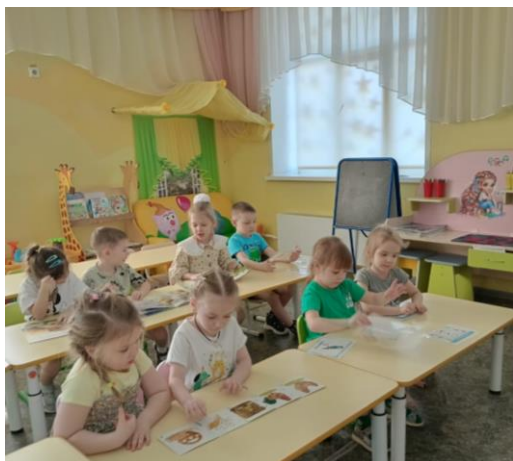
Играют в дидактические игры