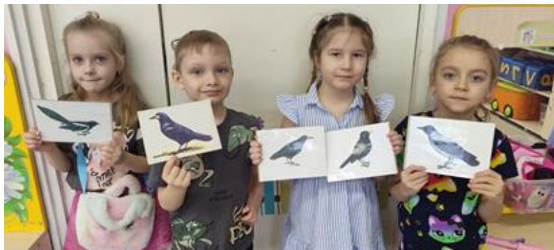
Закрепили знания о птицах родного края