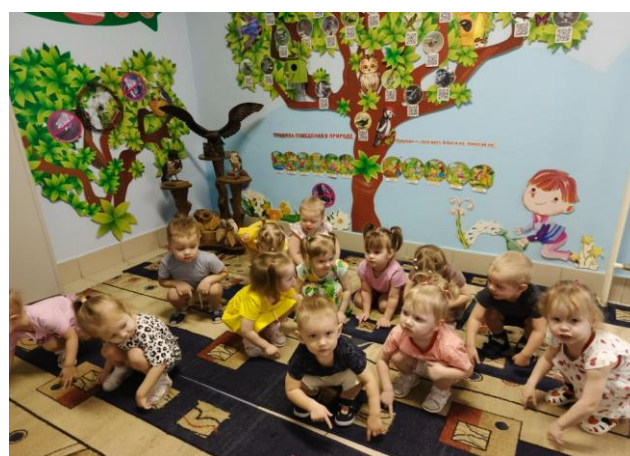
В экологическом центре рассматривают птиц, слушают как поют птицы при помощи QR-кода, играют в пальчиковую игру «Птичка»