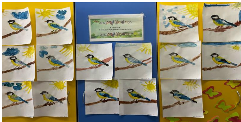
Фотовыставка рисунков - синицы