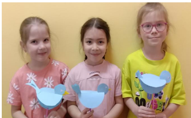
Изготовили птичек из бумаги