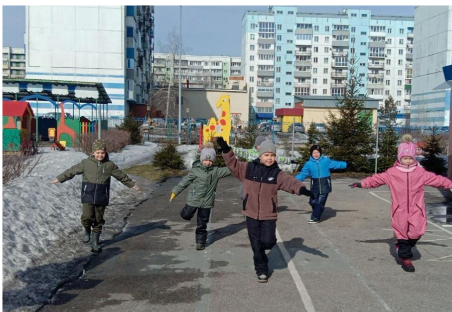
Играют в подвижную игру «Птицы в гнёзда летят»

8. В подготовительной группе «Лимпопо» с детьми была проведена беседа: «Птицы родного края». Педагоги познакомили детей с птицами Кузбасса из Красной книги с целью развития интереса к жизни птиц Кузбасса. Дети узнали о многоцветии и разнообразии мира птиц в Кузбассе через загадки, стихи. Обобщили знания о птицах, их характерных особенностях (поют, кричат,