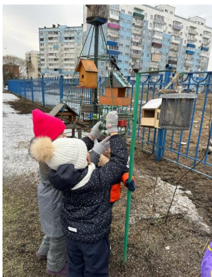
В кормушки насыпали хлебных крошек