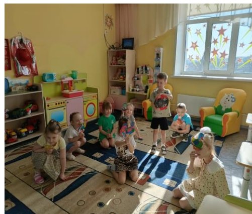
Играют в подвижную игру