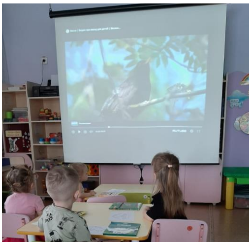
Смотрят презентацию «Птицы»