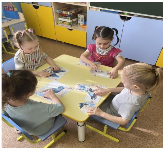
Играют в дидактическую игру