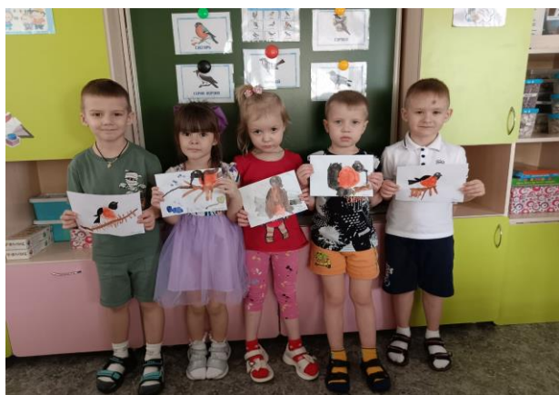
Нарисовали птичку «Снегирь»