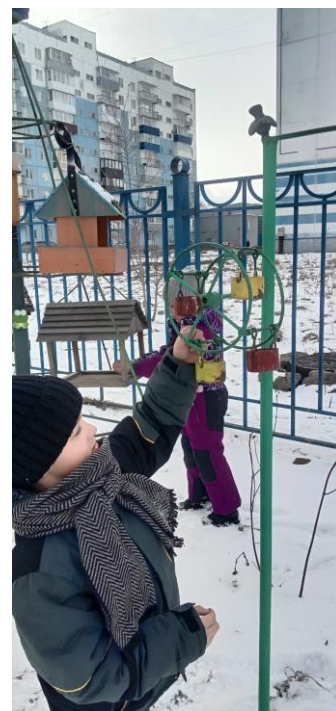
Насыпали корм в кормушки в птичьем городке