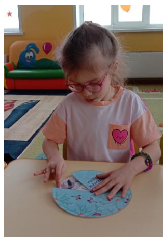
Играют в дидактическую игру «Чем можно и чем нельзя кормить птиц»