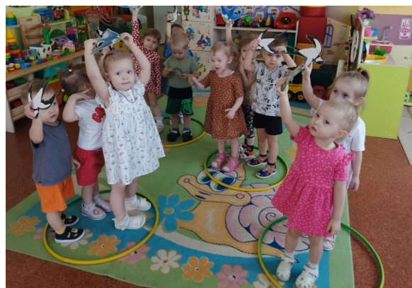
Играют в подвижную игру «Птички в гнёздышке»