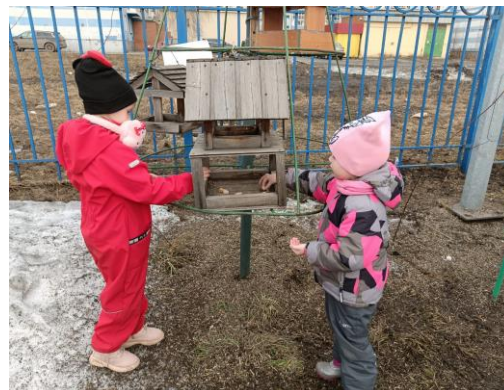
Покормили птичек в птичьем городке