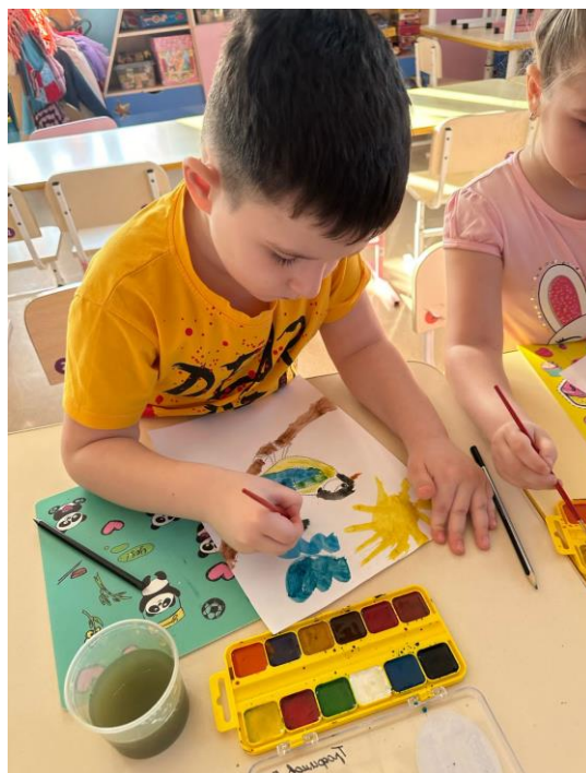
Рисуют зимующую птицу - синичку