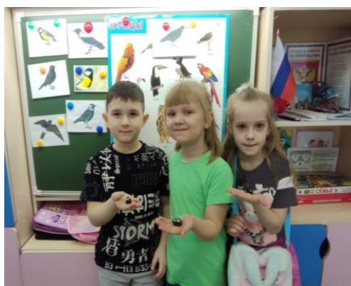
Лепят птичку, и вот такие замечательные птички получились у ребят