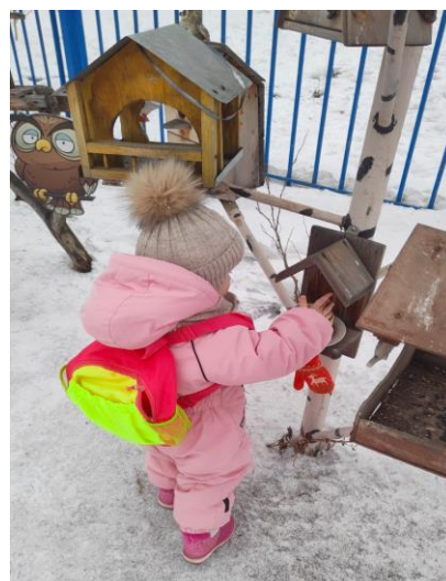
Насыпали для птичек корм в кормушки на птичьем дворе

3. Во второй младшей группе «Фиалка» педагоги провели беседу с детьми «1 апреля - Международный день птиц» с целью ознакомления детей с этим праздником и о его значении. Педагоги познакомили детей с особенностями жизнедеятельности различных птиц, интересными фактами о жизни птиц. Дети узнали, что у каждой птицы свое предназначение в природе. После беседы поиграли в пальчиковую гимнастику «Покормите птичек», затем детям было предложено раскрасить кормушки для птиц. Далее педагоги показали детям познавательную презентацию «Птицы» с целью формирования у детей бережного отношения к птицам. На прогулке дети проявили заботу о пернатых друзьях. В кормушку насыпали хлебных крошек и наблюдали, какие птицы прилетали.