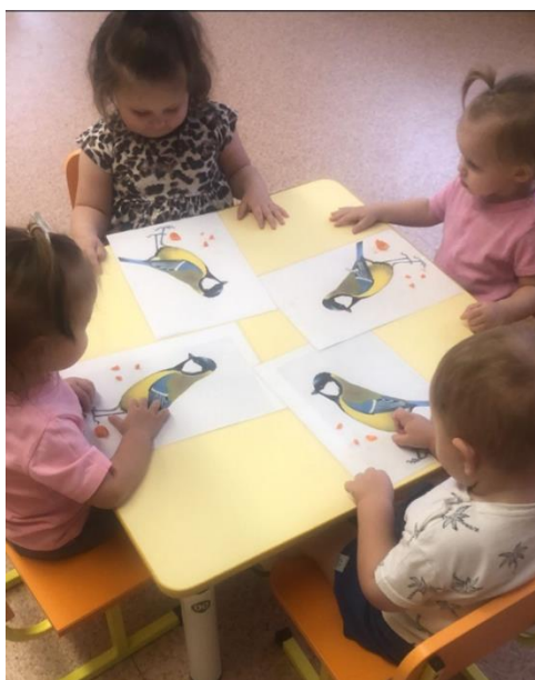
Лепят зёрнышки для птички – синички