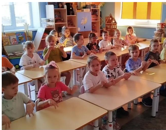
Играют в пальчиковую игру «Синичка»