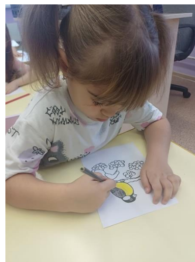
Раскрасили синичку на ветке рябины