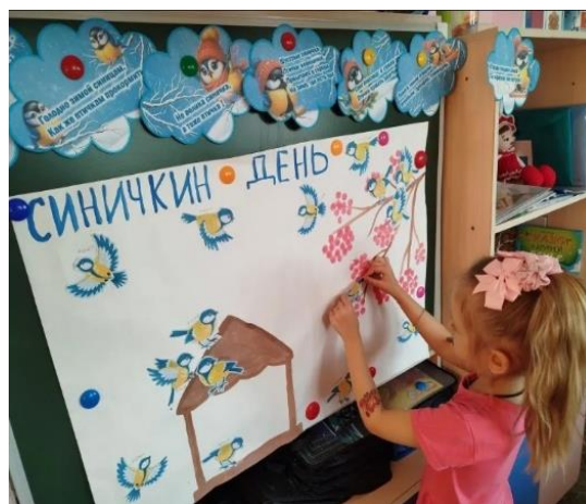
Делают аппликацию «Прилетайте птички»