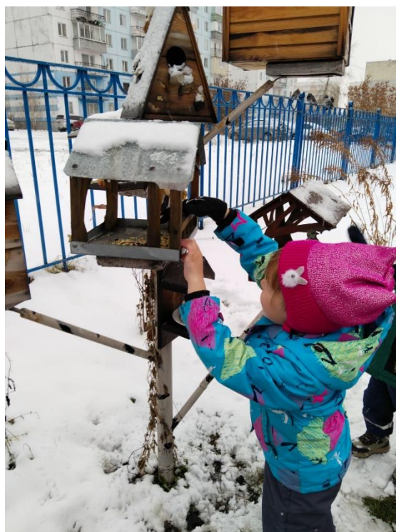
Насыпали корм в кормушки