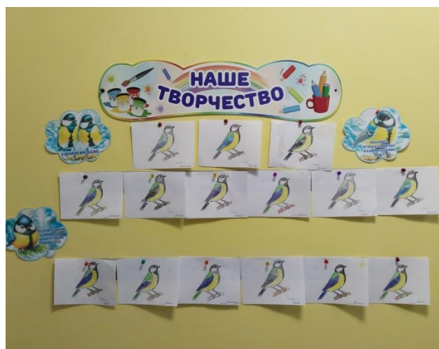
Раскрасили синичек и организовали выставку в приёмной для родителей