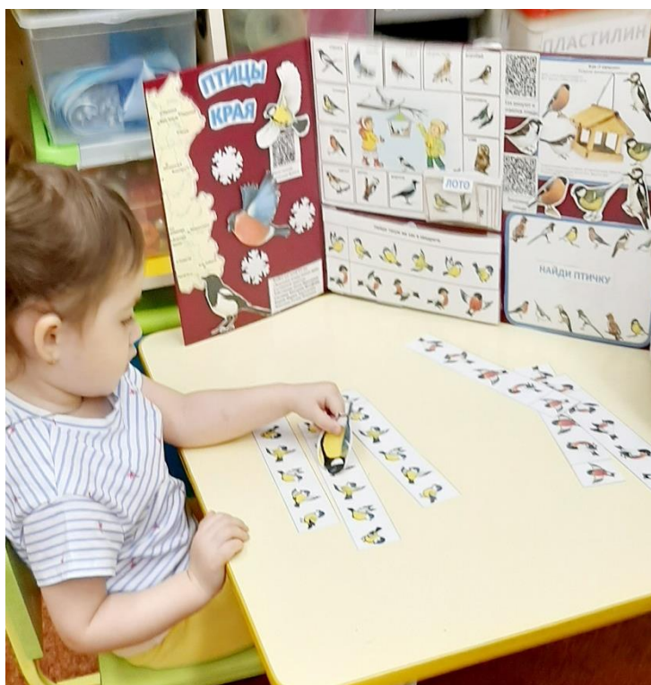
Собирают пазлы, играют в дид. Игру: «Найди синичку»

В младшей группе «Лимпопо» педагог рассказала детям, что с наступлением холодов птичкам становится трудно находить корм, и люди должны им помогать. Организовала творческую мастерскую: «Желтогрудая синичка». Дети с большим интересом приняли участие в создании коллективной аппликации. С помощью педагога они отрывали кусочки цветной бумаги (желтой, синей, зеленой) и приклеивали их на заранее заготовленный шаблон синички. Эта работа отлично развивает мелкую моторику, цветовосприятие и умение работать вместе. Самой ожидаемой частью дня стала прогулка на птичий двор. Дети взяли с собой заранее