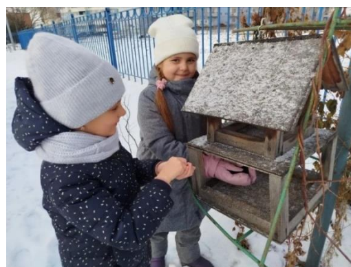
Насыпали корм в кормушки для птичек