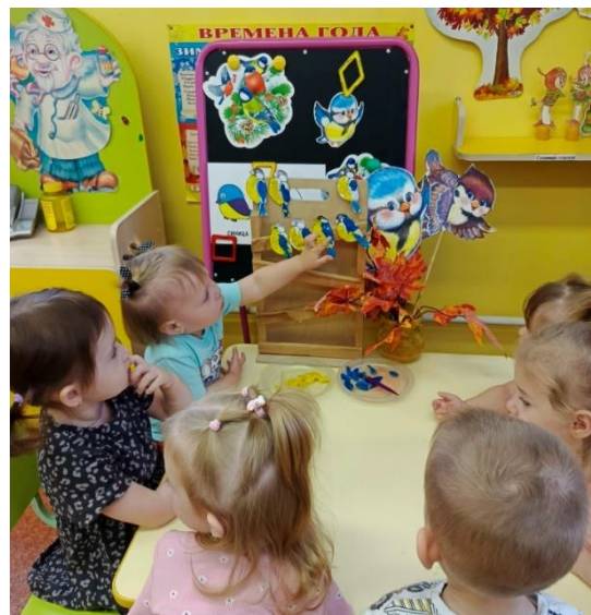
Наряжают птичку – синичку пластилином