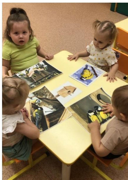
Рассматривают синичку у кормушки