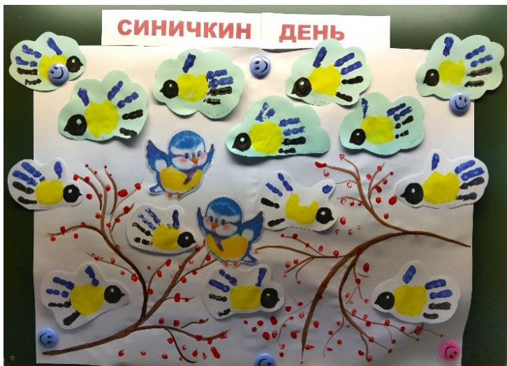
Создали коллективную работу "Синичкин день"